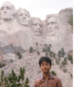
マウントラッシュモア (サウスダコタ州)

私が二十歳の時に何をしていたか?私は高校を卒業して予備校での浪人生活を経て明治学院大学に入学し上京しました。高校教師(英語)にならなかった私は、渡米して英語の神髄に触れようと留学資金を貯めるために、昼はスパゲッティ屋のコック、夜はファミリーレストランのウェイターのアルバイトを掛け持ちして、1日3時間程度の睡眠時間でフラフラになりながら働いていました。玄関・トイレ共同の4畳半のアパートで、アメリカへの憧れ、夢だけが私を支えていました。それでも「自分にはできる」という根拠のない自信がありました。